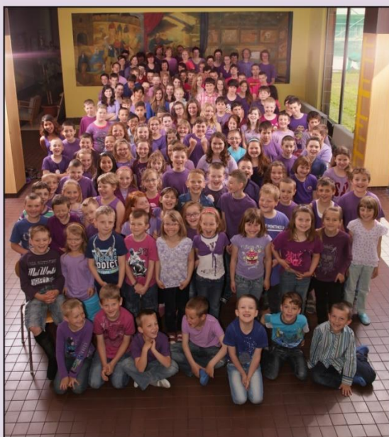
Základní škola Kravaře 2013/2014

Zpracoval: Mgr. Zdeněk Šmída, ředitel školy