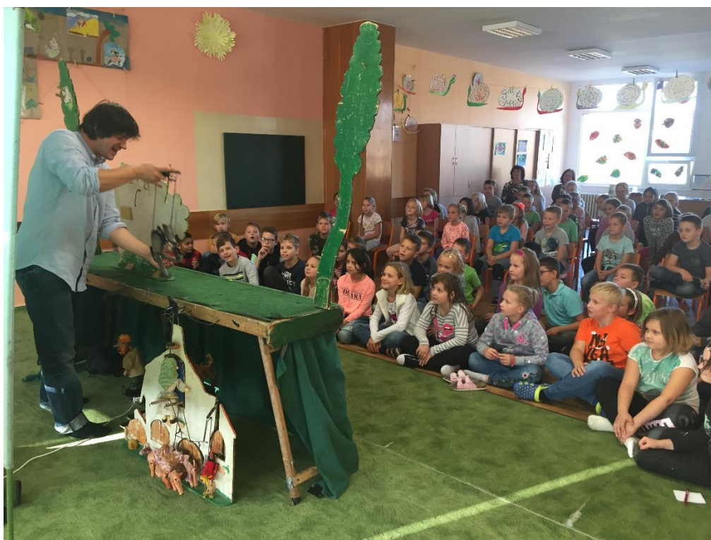
Loutkové divadlo ve školní družině.

Během školního roku nebyly vynechány oslavy tradičních i poměrně nových svátků jako jsou Dušičky, Mikuláš, Vánoce, Tři králové, Velikonoce, Čarodějnice, Den matek, Mezinárodní den dětí, Den otců.