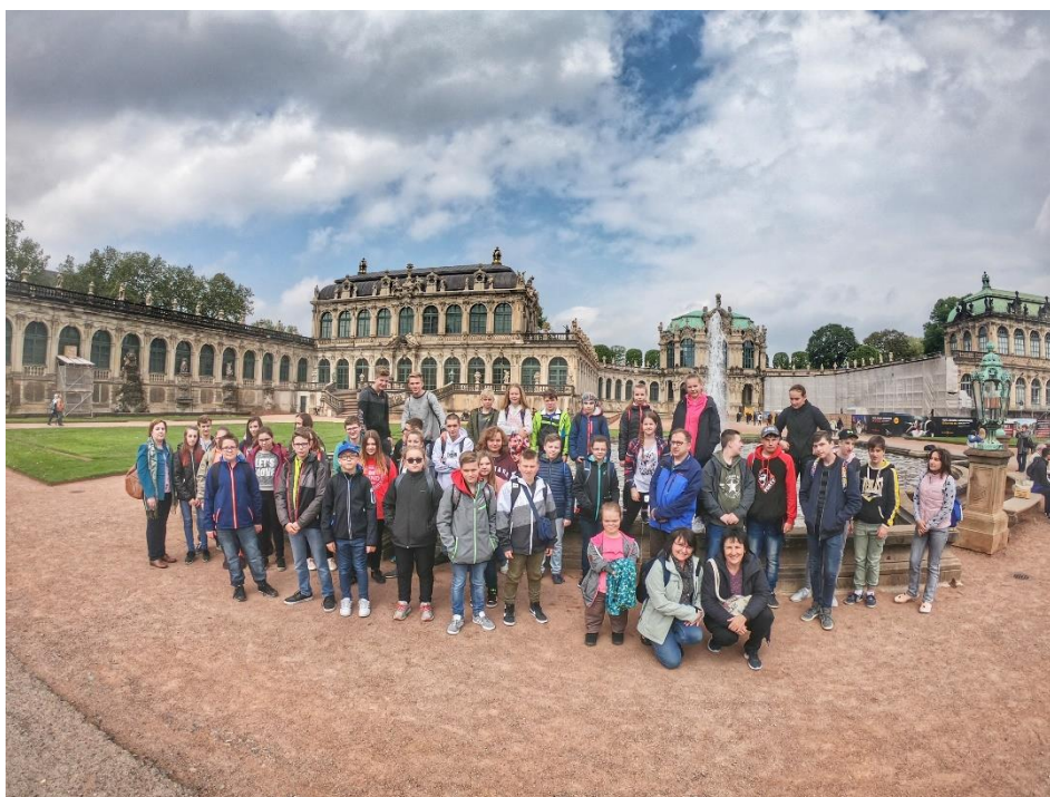
Exkurze celého 2. stupně do Drážďan 7. 5. 2019