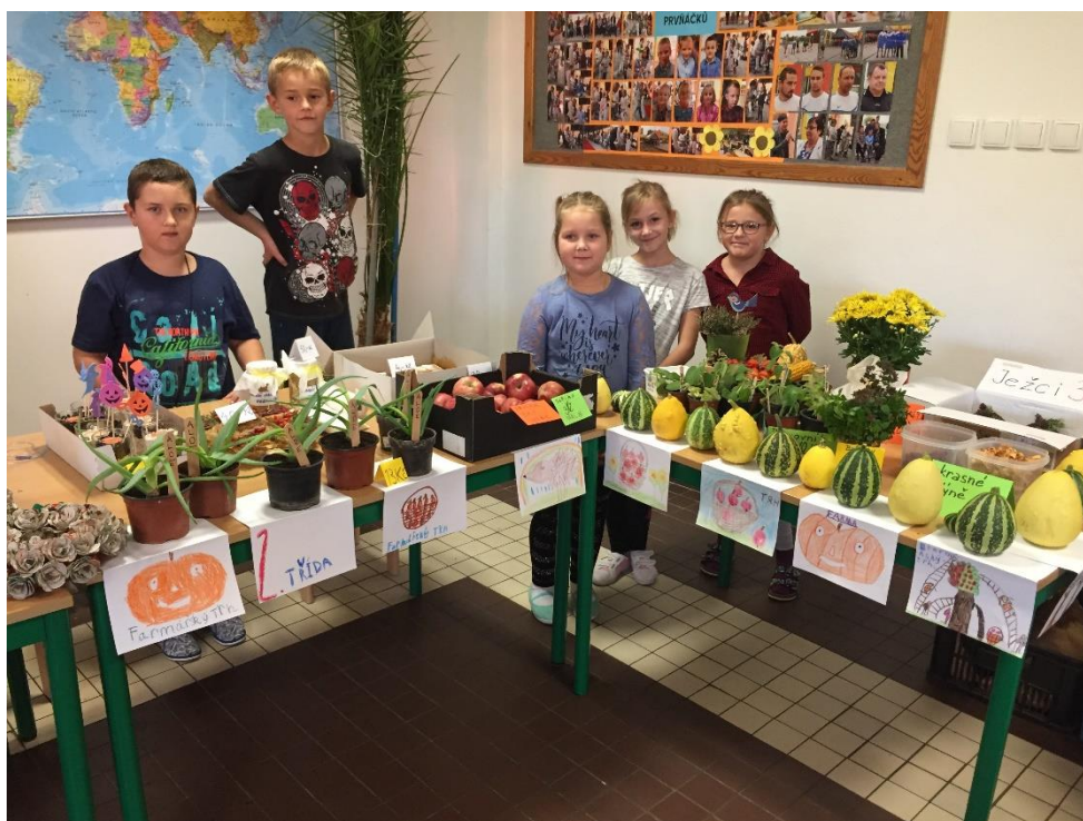
Farmářský trh 3. 10. 2018

V souvislosti s projektem Skutečně zdravá škola se v říjnu ve vestibulu školy konal farmářský trh. Žáci, rodiče i další zájemci z řad veřejnosti zde prodávali produkty ze svých zahrádek, ruční výrobky, pochutiny z karobu, dekorace a další předměty. Akce měla ohromný úspěch.