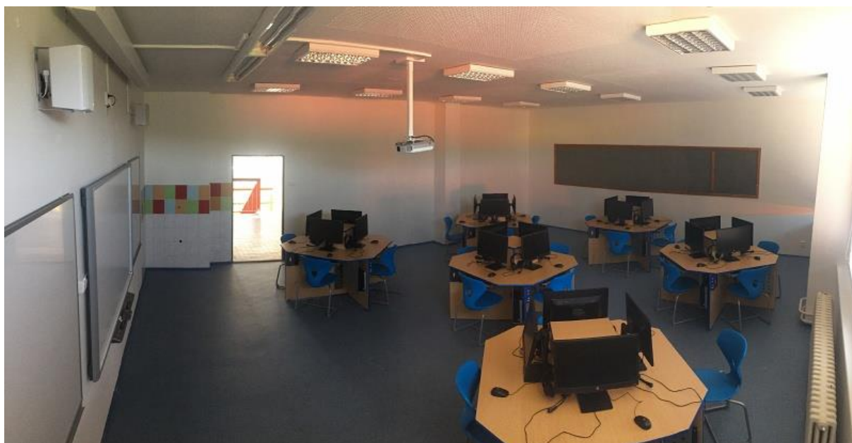
Učebna cizích jazyků v rámci projektu Moderní výuka jazyků.