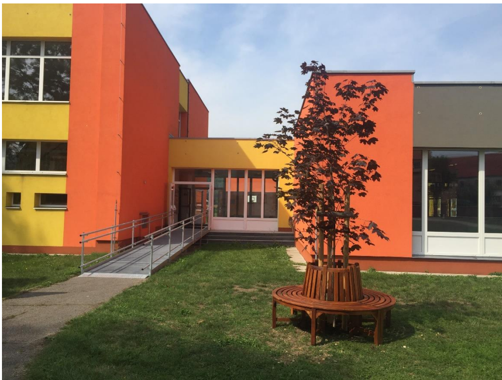
Bezbariérová rampa a vzrostlý strom s lavičkou – součást projektu IROP.